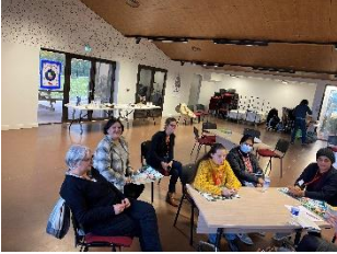
Notre 1 er Job Café avec 2 employeurs